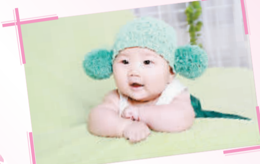
姓名:张嘉迪 性别:女 出生日期:2010年2月26日 父母寄语:祝愿我们的宝宝健康、快乐地成长。