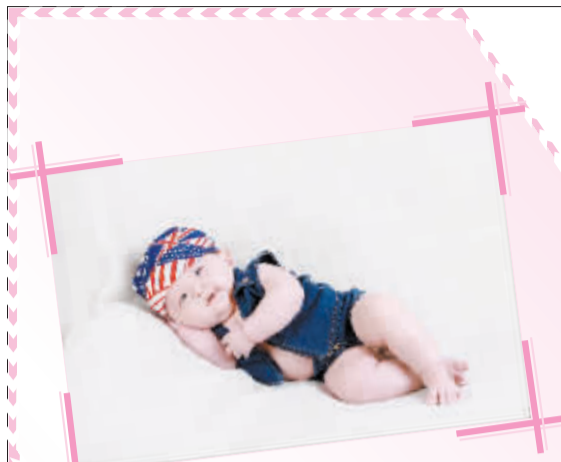
姓名:张照诺 性别:男 出生日期:2009年4月29日 父母寄语:愿你健康、快乐每一天。