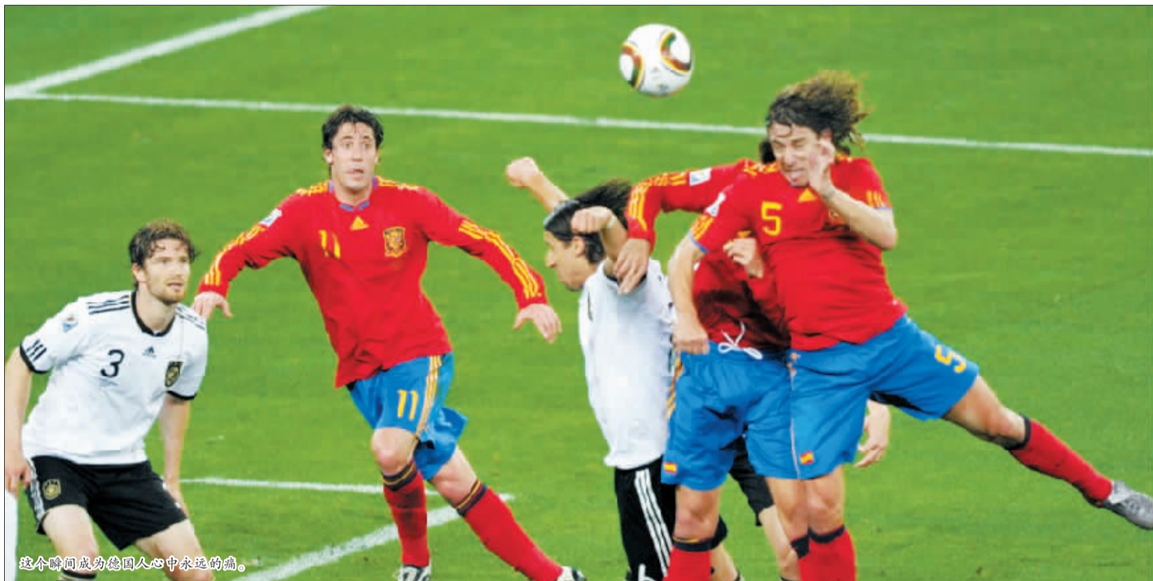
这个瞬间成为德国人心中永远的痛。