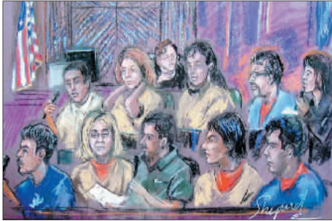
10名“俄罗斯间谍”在美国纽约一家联邦法院受审。(据中国日报网)

新华社供本报特稿 10名涉嫌为俄罗斯充当特工的被告人8日在美国纽约一家法庭认罪,被判驱逐出境,换取4名为西方情报机构工作的俄罗斯人。