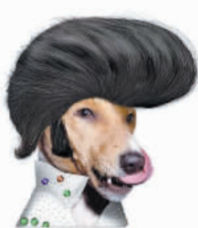
Elvis Presley (猫王)