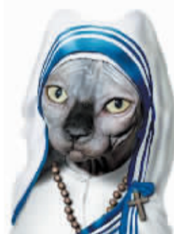
Mother Teresa (特雷莎修女)