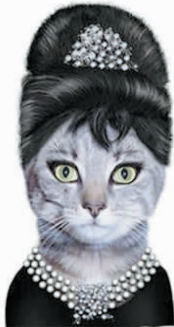
Audrey Hepburn (奥黛丽·赫本)