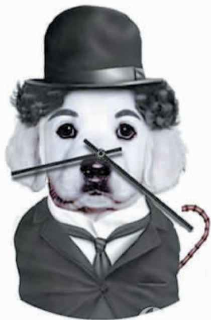
Charlie Chaplin (查理·卓别林)