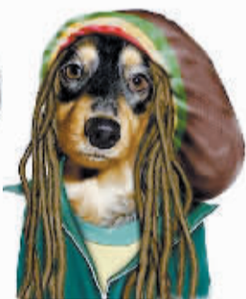
Bob Marley (鲍勃·马利)