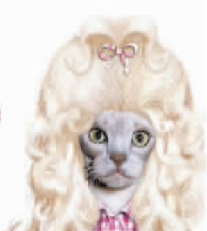
Dolly Parton (多莉·帕顿)