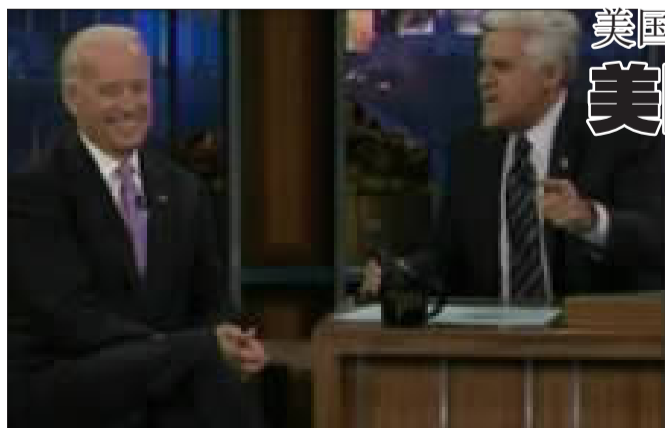
7月9日晚间,拜登(左)参加脱口秀节目时的视频截图。