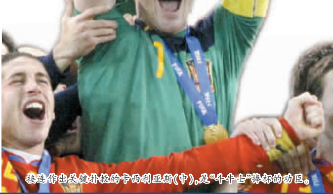
接连作出关键扑救的卡西利亚斯(中),是“斗牛士”捧杯的功臣。

西班牙队本届大赛共失两球,同样追平了历史最好成绩,与1998年的法国队和2006年的意大利队并列。难怪在女友卡波内罗赛后采访自己时,无法抑制内心激动的卡西利亚斯会在直播过程中,和她忘情亲吻呢。