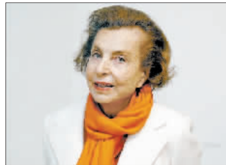
法国女首富利利亚纳·贝当古。

法国法律规定，个人为同一政治活动献金不得超过 4600 欧元，现金形式献金不得超过 150 欧元。