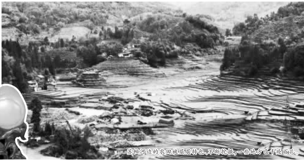
苏帕河边的农田被层层转包,不断挖掘,一些地方已千疮百孔。