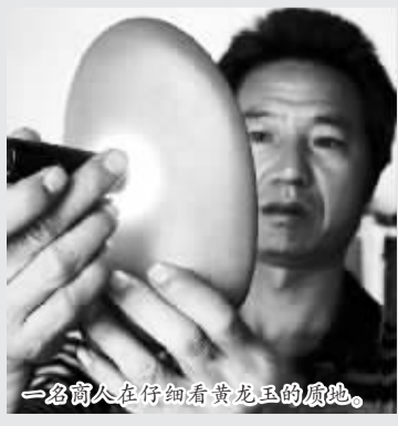
一名商人在仔细看黄龙玉的质地。

整个作业细致得如同考古学家考古。浮土全部是一锄头一锄头挖出来,然后用两个小竹筐挑走,石头则被破成小块儿,这期间,任何“可疑”的石头都会被他们捡起来仔细辨认。这些被初步挑选出来的石头,放在旁边堆成一小堆,会有一些村民过来挑选,如果合意,就会以几十元的价格买走。