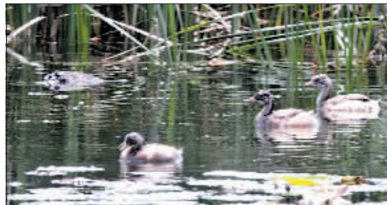
望着死去的同伴，一些鸟久久不愿离去。

网友“gh169”：看到帖子，心里特别不舒服。希望大家多呼吁呼吁，让这一问题尽快得到解决。在市区范围拥有像隋唐城遗址植物园这么好、这么接近自然的公园，在全国其他城市也不多见，这里的美好环境需要大家呵护。