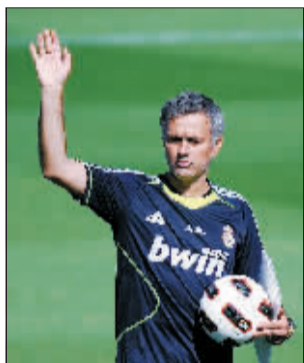
7月16日，西甲皇家马德里队新任主教练穆里尼奥带领球队在马德里进行了新赛季的首堂训练课。