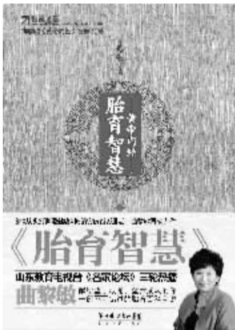
○作者 曲黎敏 长江文艺出版社

关于坐月子，有很多老规矩，比如，产妇坐月子期间不能碰凉水，不能见风，不能洗澡，不能吃生冷食物等，这些并非都是中国传统文化的糟粕，是有一定医学道理的。