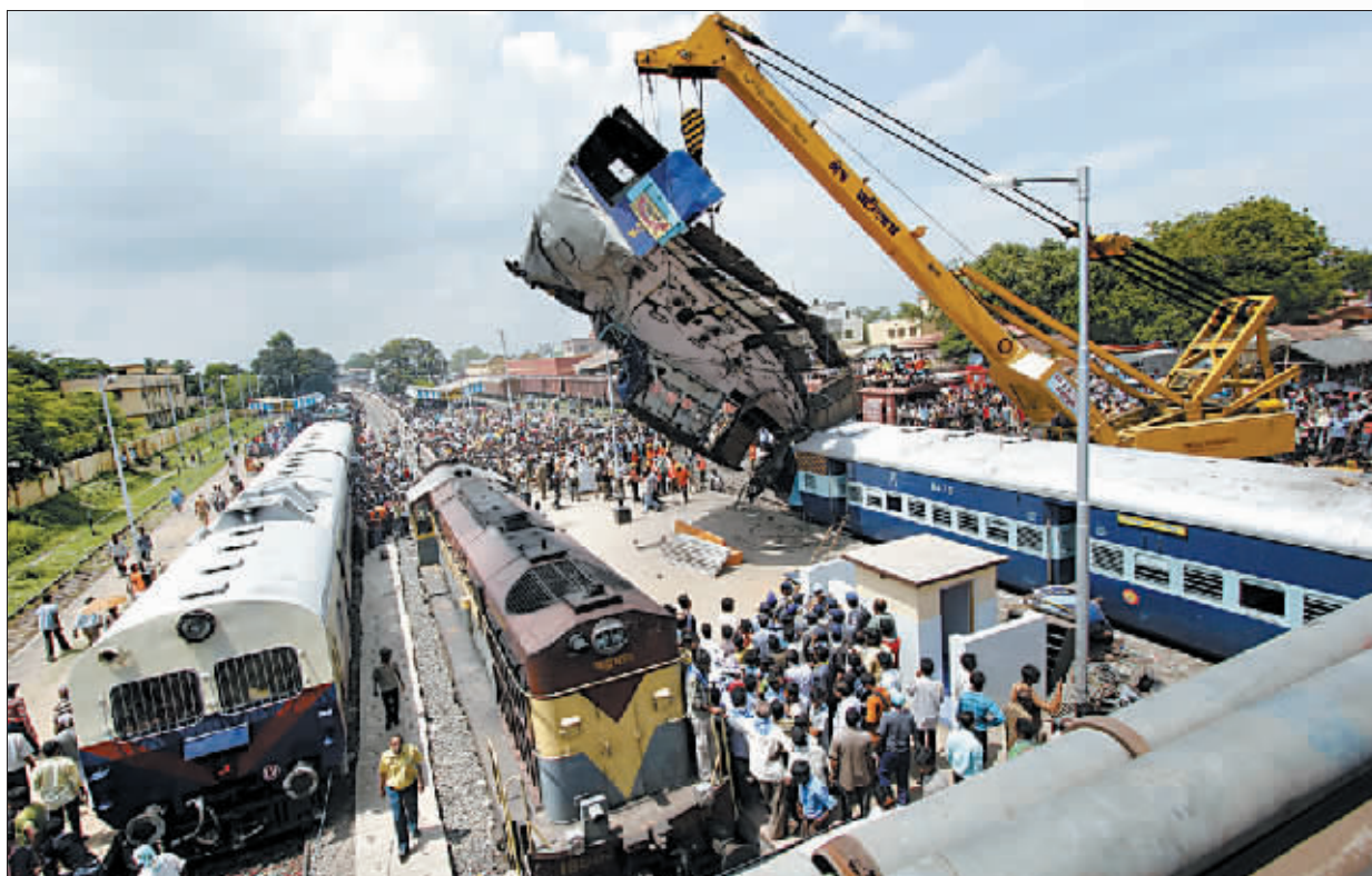
19日,在印度东部西孟加拉邦赛恩提亚,救援人员起吊发生相撞事故的火车车厢。