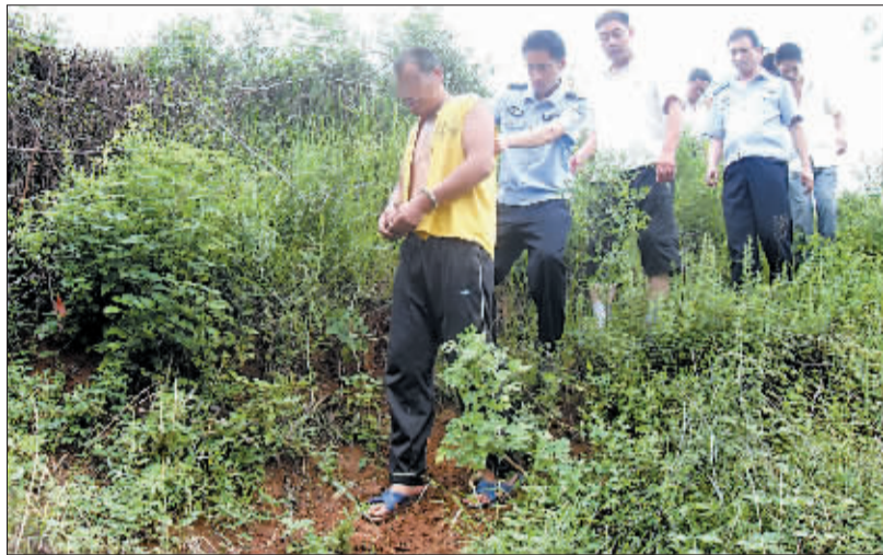
嫌疑人(前)指认现场。

昨日下午,我们向伊川县公安局核实,确有其事!目前,3名犯罪嫌疑人因涉嫌敲诈勒索罪,已被警方刑事拘留。