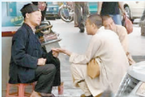
哎，这世道……以后真不知道哪个更靠谱了！