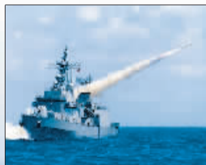
韩国海军 KDX-1 级导弹驱逐舰发射反舰导弹。