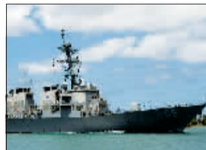
美国“阿利·伯克”级导弹驱逐舰,是世界上最先装备“宙斯盾”系统并全面采用隐形设计的驱逐舰,武器装备、电子装备高度智能化,具有对陆、对海、对空和反潜的全面作战能力。