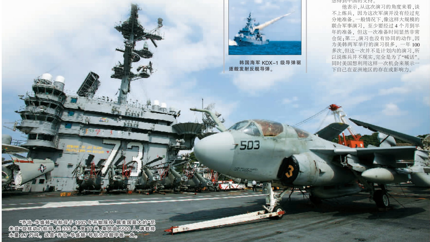
“乔治·华盛顿”号航母于 1992 年开始服役,属美国最大的“尼米兹”级核动力航母,长 333 米,宽 77 米,乘员逾 5500 人,满载排水量 9.7 万吨。这是“乔治·华盛顿”号航空母舰甲板一角。

他表示,从这次演习的角度来看,谈不上练兵,因为这次军演并没有经过充分地准备。一般情况下,像这样大规模的联合军事演习,至少要经过 4 个月到半年的准备,但这一次准备时间显然非常仓促;第二,演习也没有协同的动作,因为美韩两军举行的演习很多,一年 100 多次,但这一次并不是计划内的演习,所以说练兵并不现实,完全是为了“喊话”。同时美国想利用这样一次机会来展示一下自己在亚洲地区的存在或影响力。