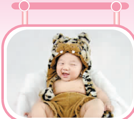
姓名:李佳昊 性别:男 生日:2010年2月18日 父母寄语:佳昊,爸爸、妈妈爱你,希望你能幸福、快乐、健康每一天!