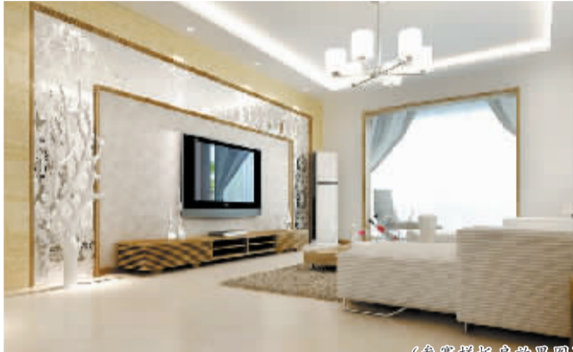
(参赛样板房效果图)

据介绍,在申报参赛作品的过程中,各参赛装饰公司设计师们积极与签订装修协议的业主进行面对面的深度交流,并数易其稿,精心打造装修设计方案,将自己最满意、最能代表设计功力的样板房设计