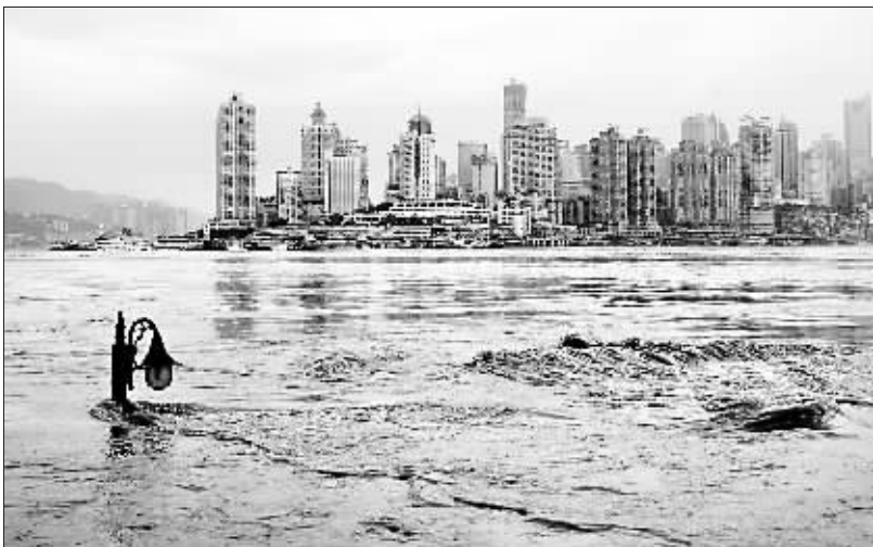
7月19日，重庆市南岸区滨江路的路灯几乎被洪水淹没。

2003年，“三峡大坝能防万年一遇的洪水”，2007年，“三峡大坝能防千年一遇的洪水”，2008年，“三峡大坝能防百年一遇的洪水”，2010年，“大坝蓄洪能力有限，不能把希望全部寄托在大坝上”，以上4种说法都来自于权威媒体。从“万”到“千”到“百”到“有限”，三峡把“牛皮吹破了吗”？22日，三峡大坝方面在接受记者专访时对此作出澄清：“大坝的防洪能力从来没有变过，是媒体在不同时期截取了不同概念，从某种意义上讲，这4种说法都对。”