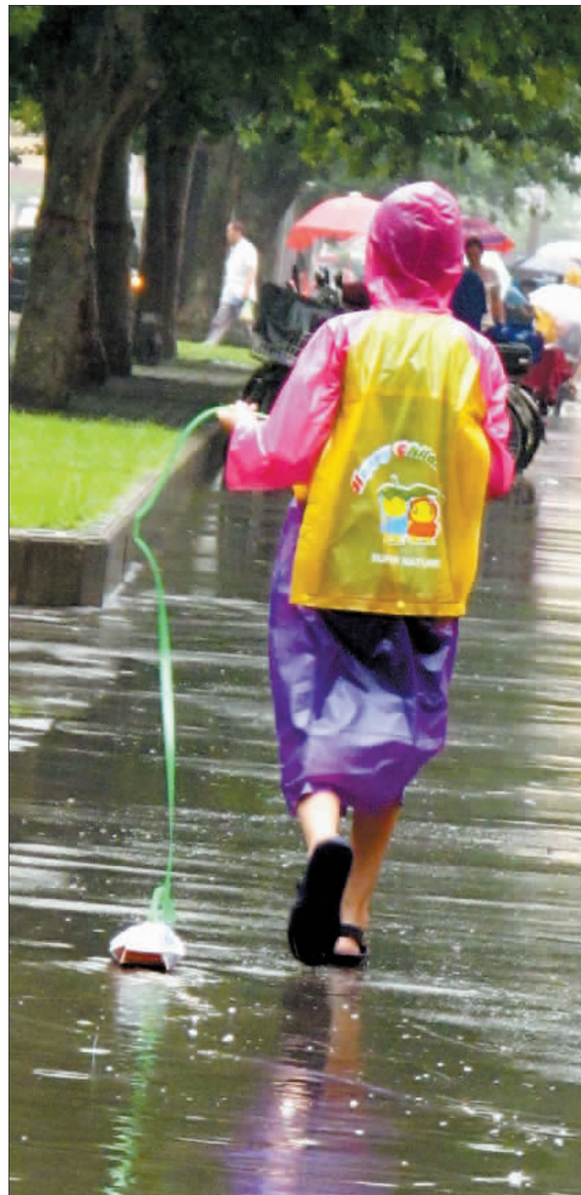
叠只小纸船，咱就牵着玩。摄于景华路