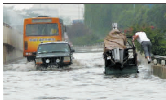
有时，推车也有技术含量。摄于定鼎立交桥