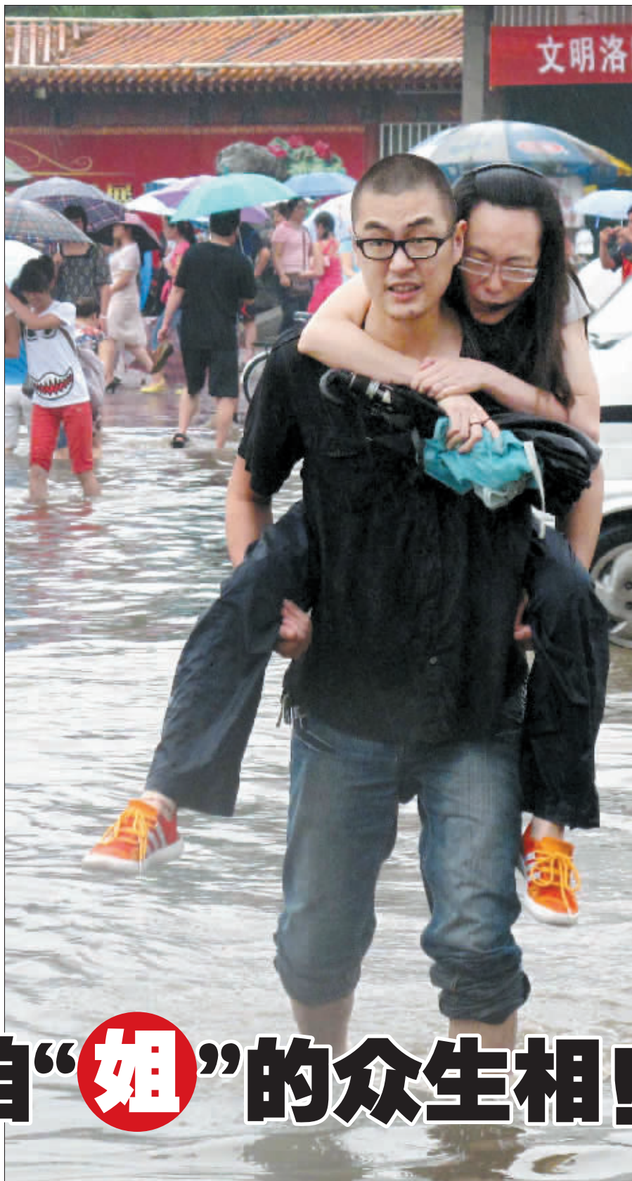
男子汉，背着一份责任。摄于西苑公园门口