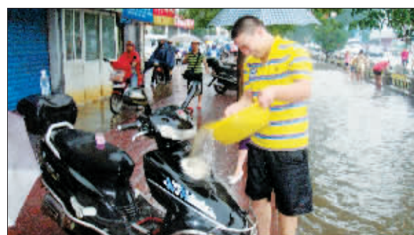
有时，洗车也可以很节约。摄于中州路与定鼎路交叉口