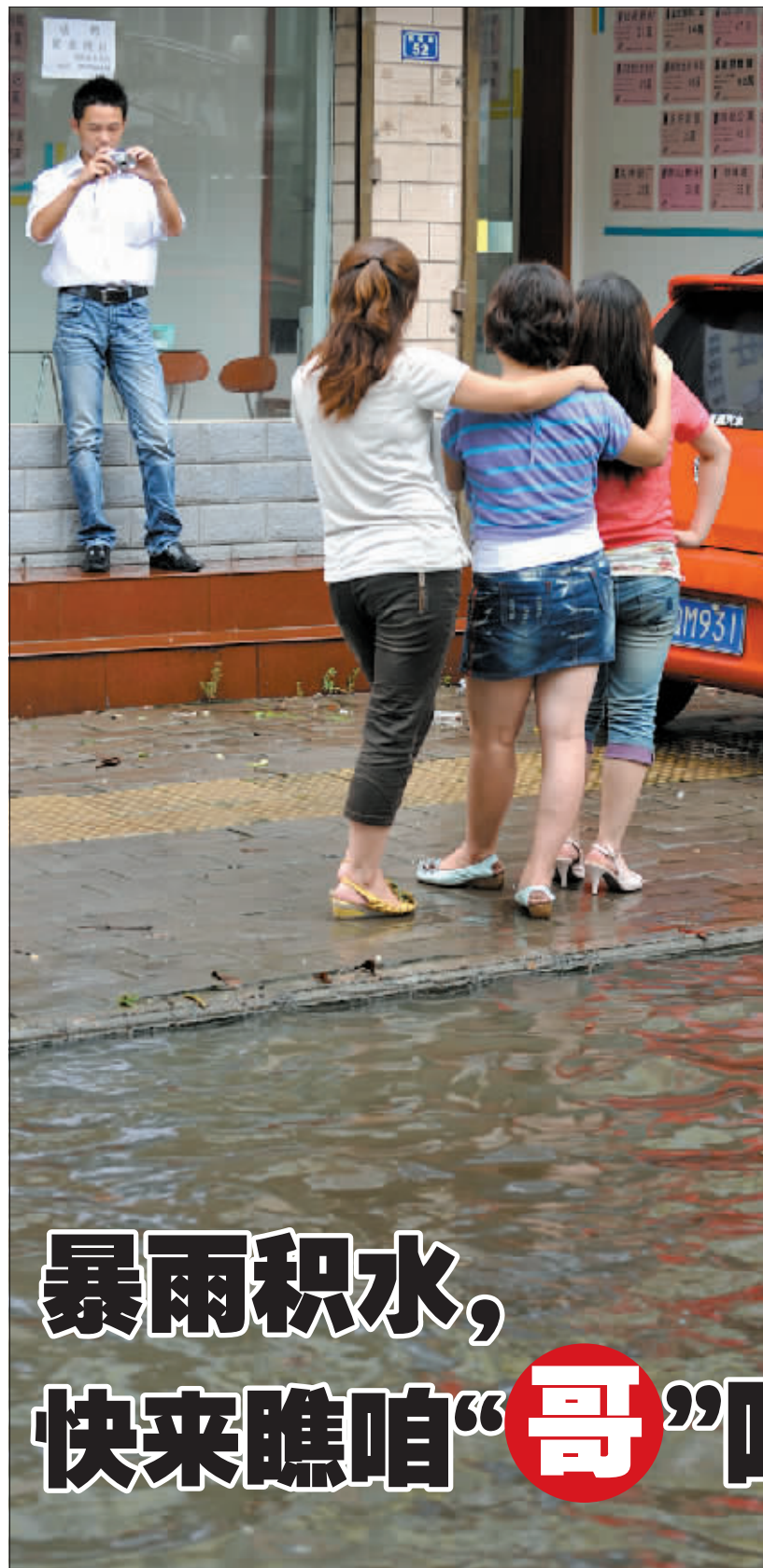
姐们儿摆造型，咱来留个影。摄于丽春路

雨中，尽职尽责的交警令人感动。 A图摄于黄河路与九都路交叉口；B图摄于中州西路；C图摄于九都路