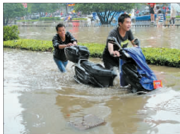
有时，友情显得格外重要。摄于九都路