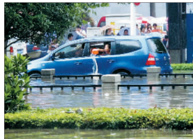
有时，车上备“水果”很必要。摄于南昌路

“欢跳哥”为一名青年男子，旁人对积水很无奈，他却似乎很享受。只见他赤裸上身跳进水中，身体剧烈地摆动保持平衡。最后，他竟在积水里一路小跑！他的奔跑不仅溅起了一片水花，也引来周围人的惊叹。