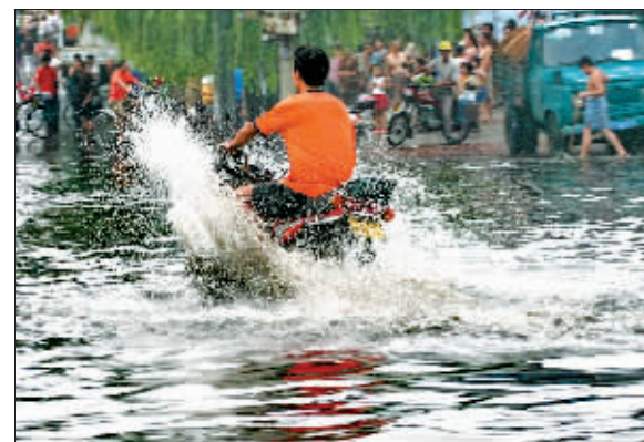
有时，摩托也会变成快艇！摄于定鼎路