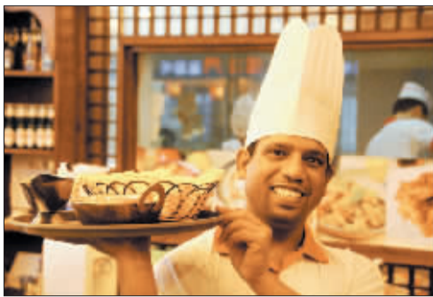
幸福工作着的卡什。