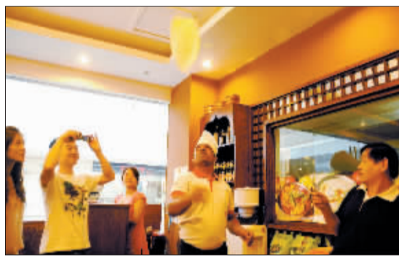
小露一手，制作“飞饼”。