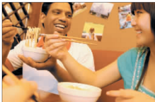
半年来，卡什越来越有“中国味儿”了。