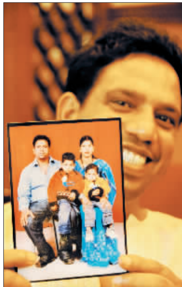
幸福的一家“随时在身边”。