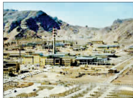
伊朗伊斯法罕的一处核设施——铀转换工厂。