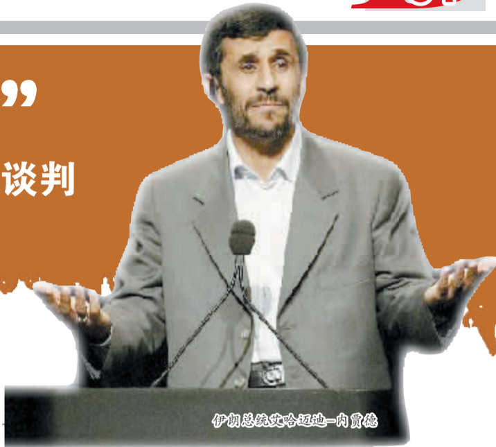
伊朗总统艾哈迈迪-内贾德

欧洲联盟27个成员国外长26日举行会议，通过了主要针对伊朗能源领域的单方面制裁措施，以敦促伊朗就其核计划重启谈判。