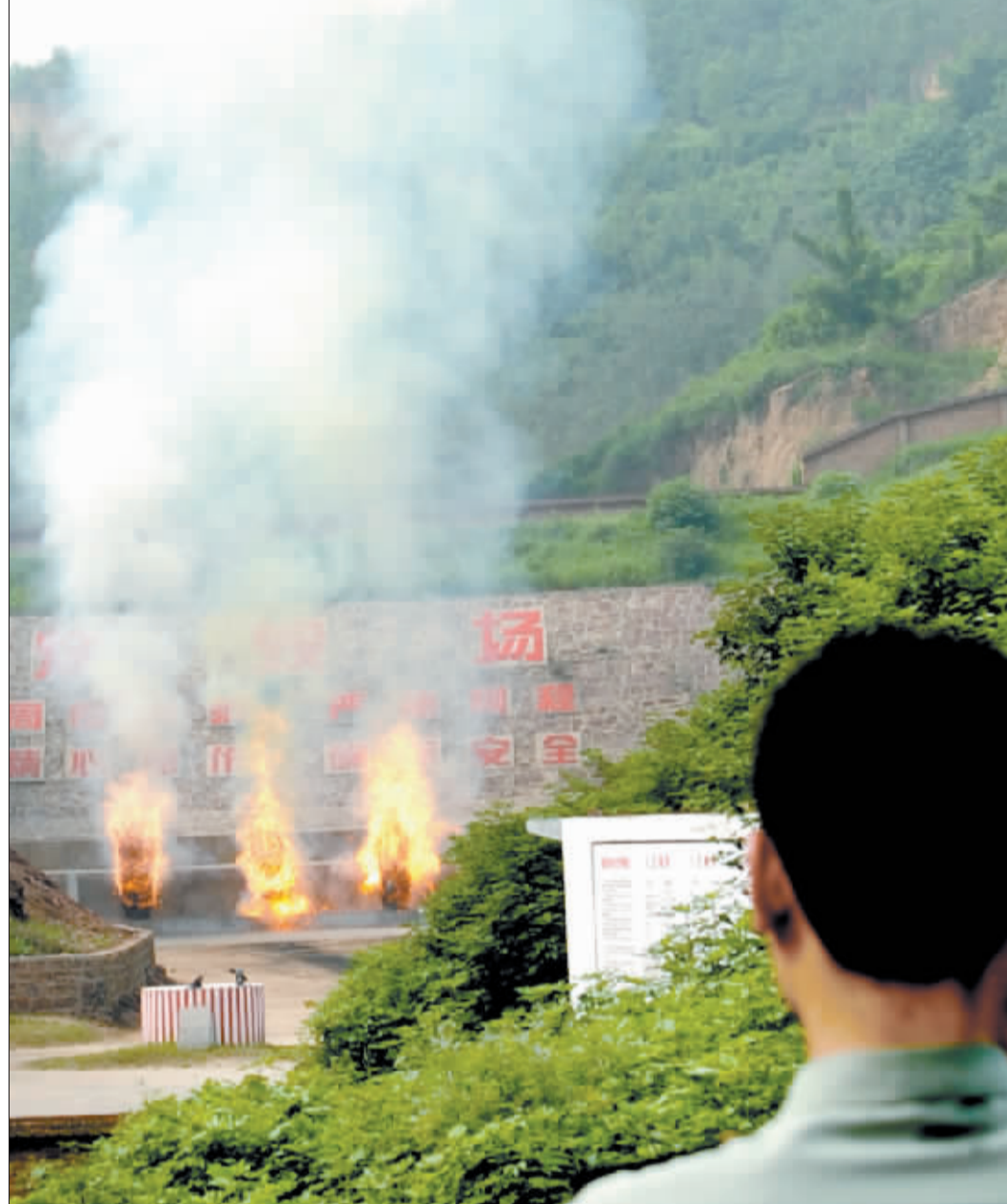
伴随着轰轰巨响,又一批弹药被销毁。