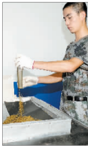
处理炸药是个精细活。