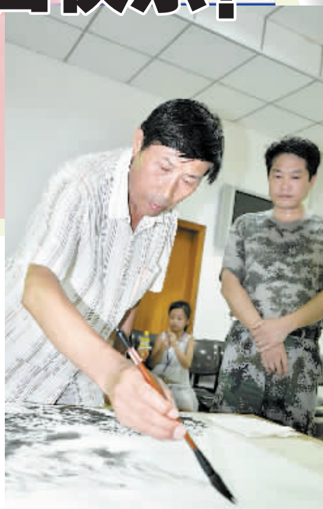
书画院解院长现场作画。

小记者投稿邮箱：woshixiaojizhe@126.com 咨询电话：63232410