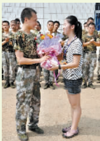
给“最可爱的人”献花。