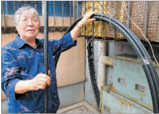
水管咋是黑色的？不少居民有疑虑。

一样，“除了黑褐色以外，还有白色、绿色、蓝色的等。光线不足时，辨认这些喷码会有些困难，所以居民们会产生‘管子没标志’的误会”。