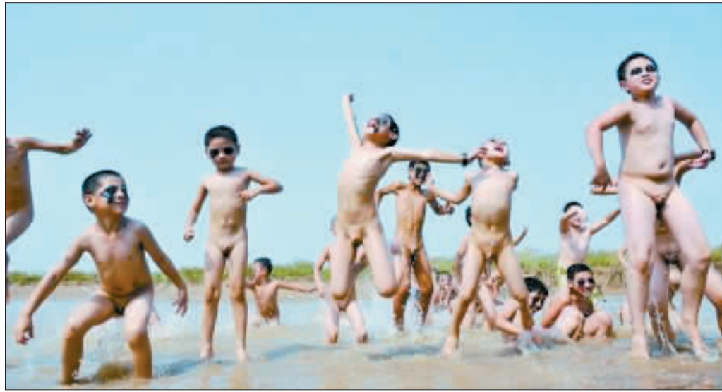
孩子们在黄河滩地的浅水区玩耍。