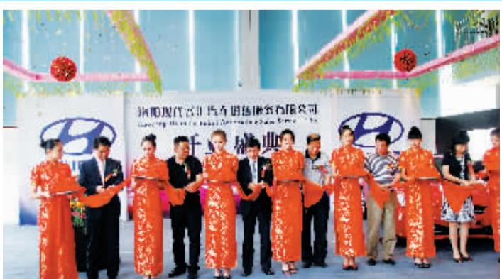
8月6日,现代汽车洛阳普汇4S店盛大开业。该店的开业使消费者在洛阳本地就能买到纯正的韩国现代进口车,也使消费者在洛阳就能享受到更加周到、便捷的服务。