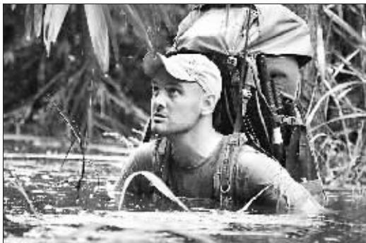
斯塔福德在丛林中涉水前行。