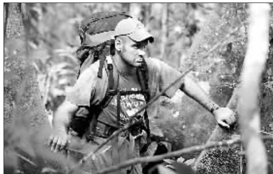
斯塔福德在丛林中跋涉。