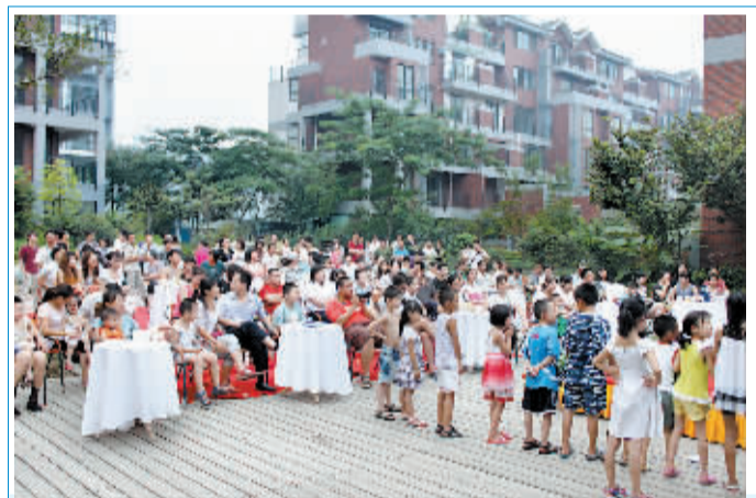
8月7日下午,东方经典小区内人头攒动,热闹非凡,东方经典3期境界嘉年华活动在此隆重举行,数百名准业主参加了活动。品美酒、鉴名车、赏人体绘画艺术、陶艺DIY等丰富多彩的活动将现场气氛推向了高潮,每一位到场的客户都感受到了境界嘉年华的魅力。图为活动现场。

在6天的行程中,大家就就地产宏观调控、洛阳楼市的未来走向等热点问题进行了深入探讨。