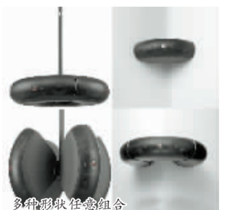
多种形状任意组合

除了有独特的造型,它还内置有三个声音单元,分别是 5 英寸的低音单元(两个)和 1 英寸的高音单元。这款产品的尺寸为 14.3 英寸 x 10.4 英寸 x 5 英寸,重 12 磅,并且有黑白两种颜色可以选择。