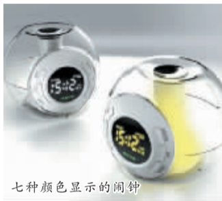
七种颜色显示的闹钟

这个闹钟有一个 LCD 液晶显示屏,包括计时器,12/24 小时显示,有闹铃和助眠功能。它还带有内置的温度传感器,并提供在摄氏和华氏两种环境温度的读数。