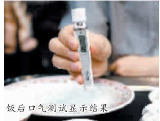
饭后口气测试显示结果