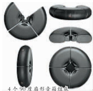
4 个 90 度扇形音箱组成

这款音响由美国音响业界名企 JBL 设计生产,它有 4 个 90 度的扇形音箱,可以组成多种样式。无论是墙角、门边还是天花板上,都可以成