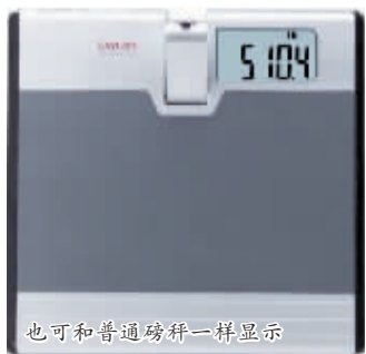
也可和普通磅秤一样显示

现中间有个投影灯,可以把体重数字投影到墙上。这对胖子和孕妇来说无疑是一件绝好的产品,因为他们想要看到体重秤显示出来的数字,可不是一件容易的事情。这款产品可以让行动不变的朋友轻松地了解自己的体重情况。