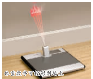
体重数字可投影到墙上