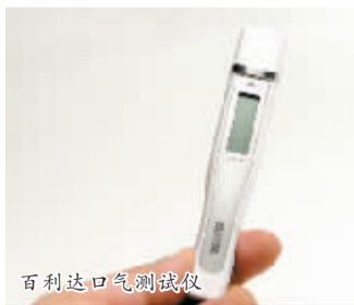
百利达口气测试仪