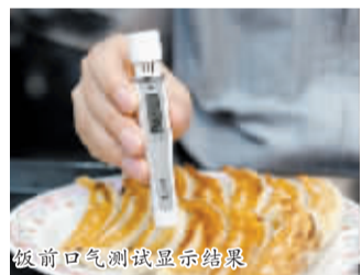
饭前口气测试显示结果

除了身材小巧,这款测试仪操作起来也非常方便,你只需拉动上面的盖子打开电源,这时会有倒计时的提示音,保持 1cm 的距离,对着上面的小孔有节奏地哈气至提示音嘀嘀响。它会分 0~5 六个等级显示结果,在液晶屏上显示相应数字。