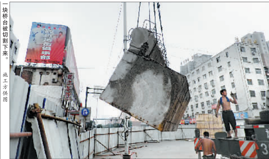
一块桥台被切割下来。