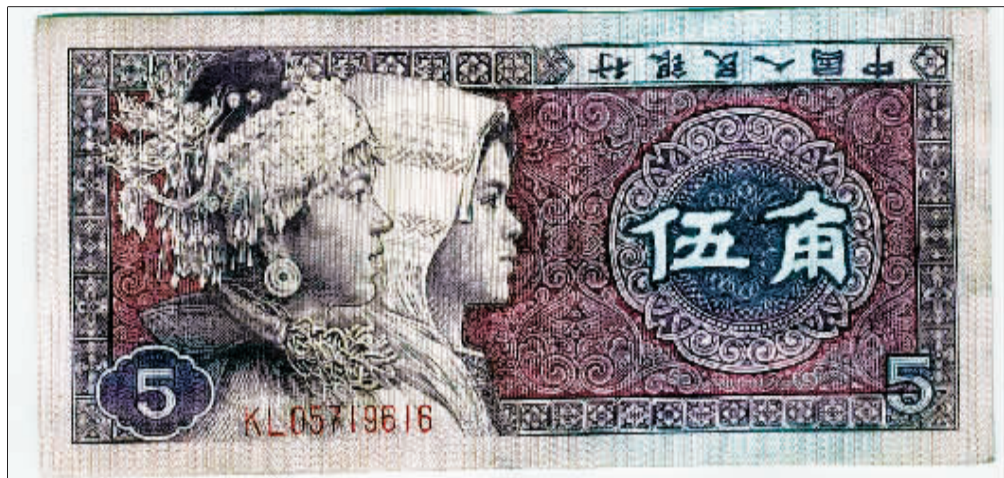
嫌犯自制的“错版伍角人民币”。