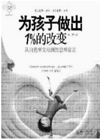
○作者 郑委 北京大学出版社

家长教育的缺失，导致中国家长的不成熟。我们把不成熟的父母定义为“自然型父母”，希望家长们通过学习，成为“智慧型家长”。