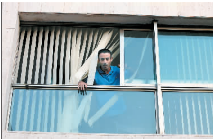
十七日，因贾兹闯入位于以色列特拉维夫的土耳其驻以色列使馆后从窗口向外张望。

据新华社耶路撒冷8月17日电 一名巴勒斯坦男子17日傍晚闯入位于以色列特拉维夫的土耳其驻以色列大使馆寻求政治避难，并威胁说如不能满足其要求将烧毁使馆。