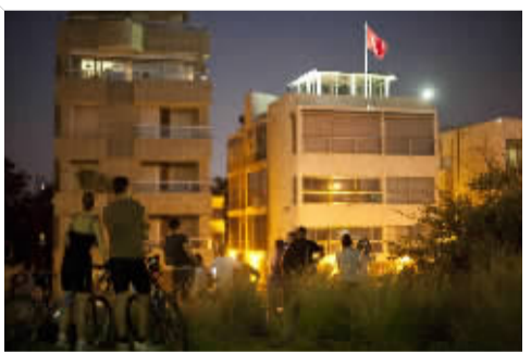
人们在使馆外围观。