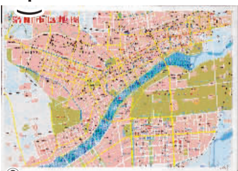
图①:第二十四届牡丹花会期间印制的洛阳娱乐地图。

早期的牡丹花会地图,虽然仅有不到30年的历史,但其在用纸、色调、版面设计、表现手法、绘制精度等方面均有独到之处,具有一定的观赏性。加之牡丹花会在洛阳的特殊地位,花会地图足以反映洛阳这一历史阶段的社会变迁、地理风貌、人文景观、交通建设等,对后人研究洛阳历史具有较大的作用,从而使得早期的花会地图,已经彰显出其文物价值。前几年,在郑州举办的一次旅游收藏品拍卖会上,全套(4种版本)的首届洛阳牡丹花会导游图,起拍价已达数百元。