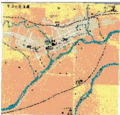
图④:首届牡丹花会期间原洛阳轴承厂印制的花会导游图。