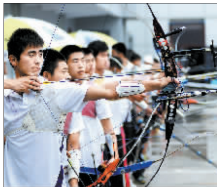
参赛队员满弓待发。