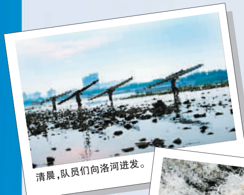
清晨,队员们向洛河进发。