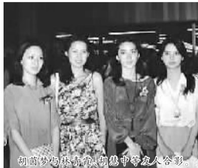
胡茵梦与林青霞、胡慧中等友人合影。