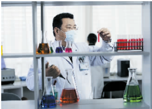
洛阳协和医院男科诊疗中心协办 电话:63211111

为了让男性患者早日摆脱疾病困扰,更好地体验男科疾病规范检查超市的实惠,洛阳协和医院男科疾病规范检查超市,针对前列腺炎、前列腺增生、前列