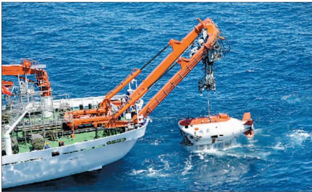
这是“蛟龙号”深海载人潜水器于2010年7月在中国南海执行一次成功下潜后出水。