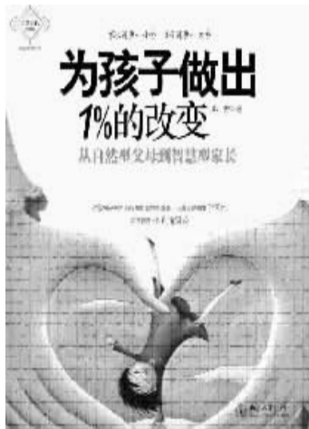
作者 郑委 北京大学出版社

人生的第七个关键点，是婚后第15年到第35年，这个阶段，孩子一般处在青春期至恋爱择偶或刚步入婚姻阶段。我们把这个阶段称之为“中年婚姻的多事之秋”。这一阶段是第二大离婚高发期。