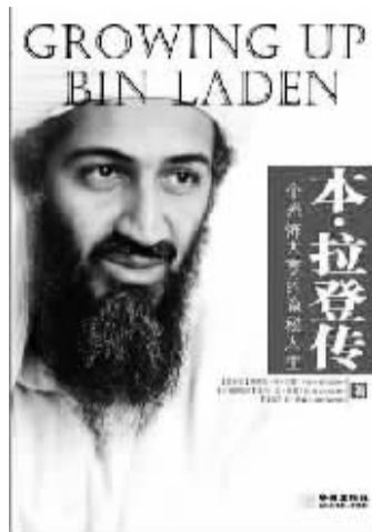
作者:简·萨森(美) 金城出版社

虽然自从1994年沙特政府冻结父亲的资产之后我们就很穷了,但是我们现在面临着新的问题。自从父亲失去自己的资产之后,他那个庞大的组织就只能依靠别人的施舍过活。同情父亲的王室、沙特平民,甚至是父亲家族的直系亲属都给圣战事业捐过钱。到当时为止,还没有人规定他们不能向父