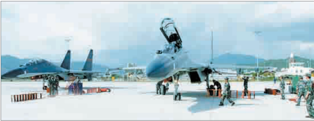
战机在民航机场加油后准备起飞。