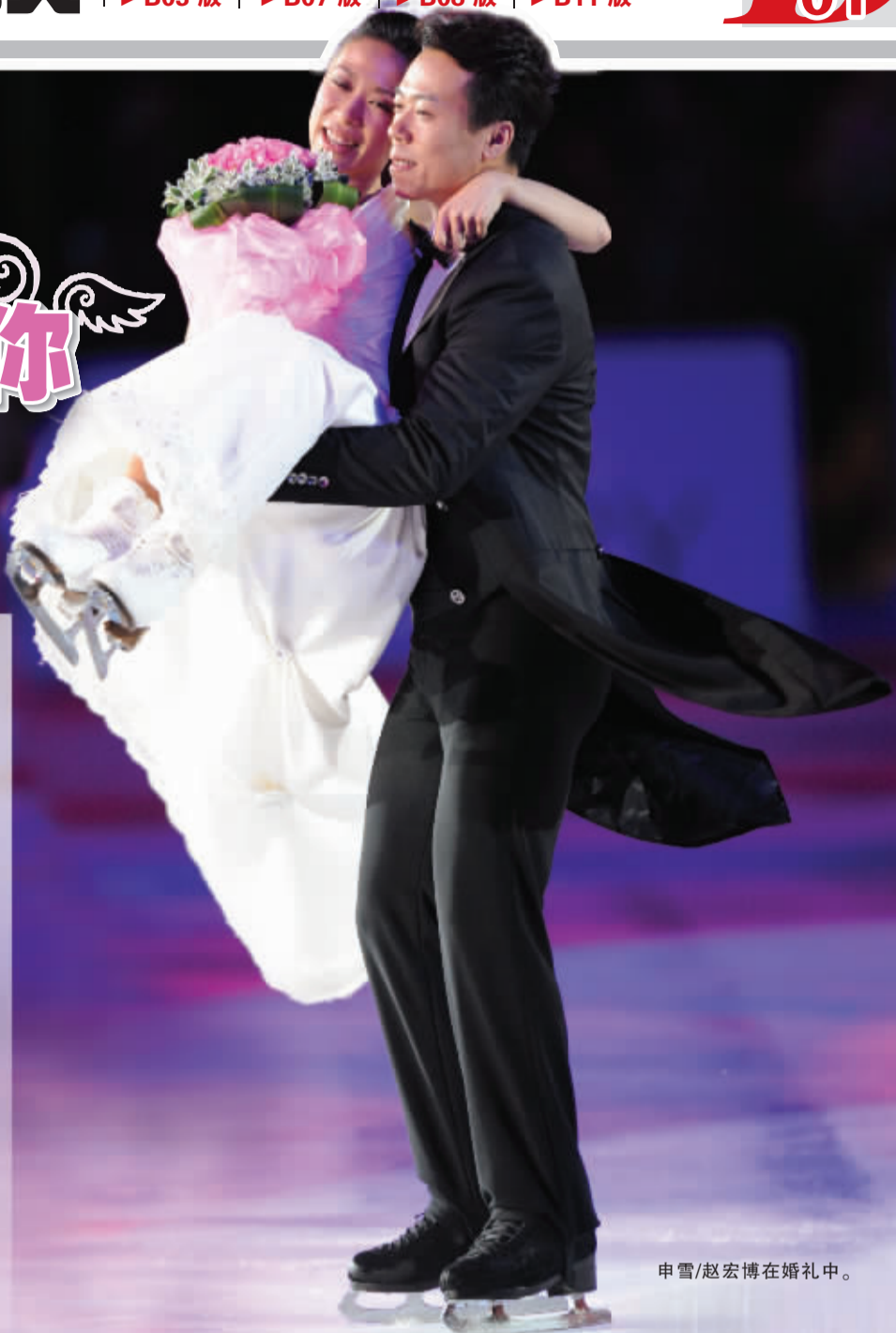
申雪/赵宏博在婚礼中。

今年2月的温哥华冬奥会上,为中国代表团首夺双人滑金牌的申雪、赵宏博当即宣布退役,此前他们已经夺得了三届世界锦标赛冠军并于2007年暂别冰坛。这对冰上情侣于2007年登记结婚,但是一直没有举行婚礼。