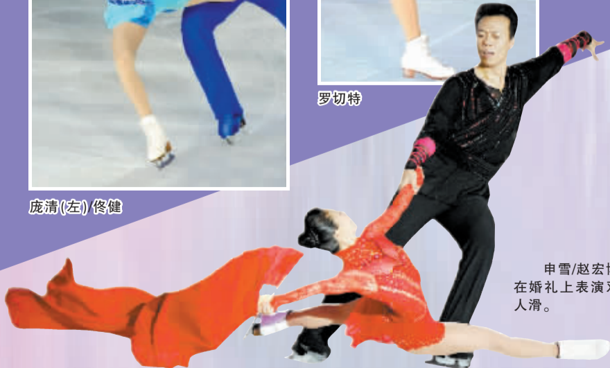
申雪/赵宏博在婚礼上表演双人滑。