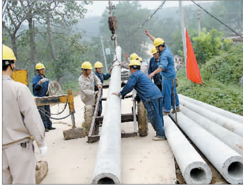
电力部门正在抢修。

记者随后走访了会盟镇雷河村、送庄镇十里村、白鹤镇曙光村,由于电力保障到位,几个村均未出现“水荒”。