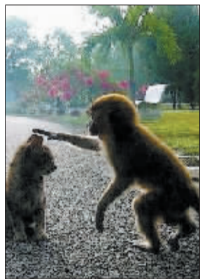
▲ 乖啊，小猫咪！