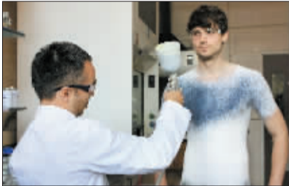
▲ 第三步:托雷斯博士决定加上迷人的蓝色喷雾。