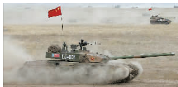
中方主战坦克向目标推进。

综合新华社消息 “和平使命—2010”联合反恐军演各方参演部队,18日在哈萨克斯坦南部马特布拉克训练场举行第四次实兵合练。这是各国参演部队首次举行全要素、全过程部分实弹合练。哈萨克斯坦国防部部长贾克瑟别科夫现场指导观摩。