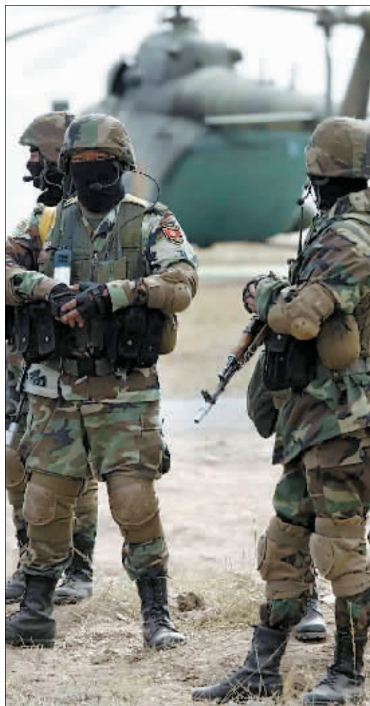
塔吉克斯坦特战队员进行战斗准备。