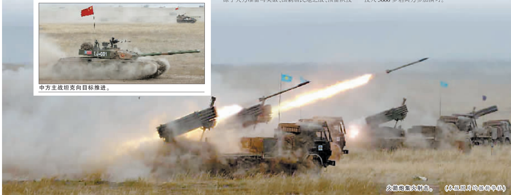
火箭炮集火射击。

“和平使命—2010”联合军演9月9日至25日在哈萨克斯坦阿拉木图市和马特布拉克诸兵种合成训练场举行。演习分为战略磋商、联合反恐战役准备和联合反恐战役实施三个阶段。哈萨克斯坦、中国、吉尔吉斯斯坦、俄罗斯、塔吉克斯坦五国共投入5000多名兵力参加演习。