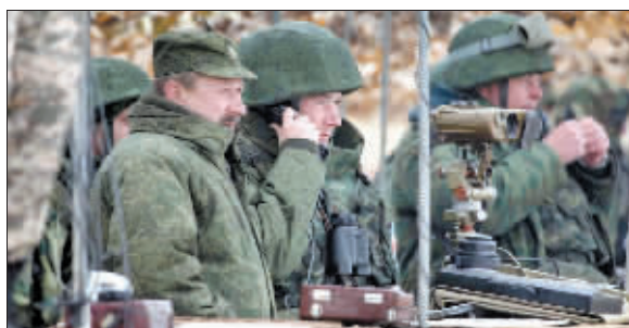
联合军演实兵指挥所的俄方军官注视前方。