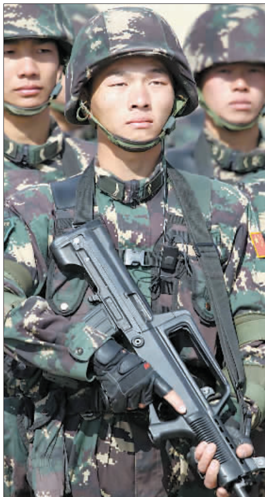
中方特战队员整装待发。