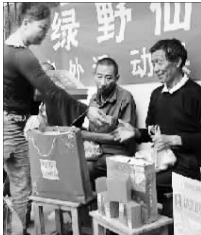
就像回家看望年迈的父母一样,为老人们送去节日的问候。