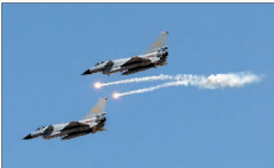
歼-10 战机发射干扰弹。

这次演习是上合组织框架内举行的第7次联合军演。为期16天的演习,分为战略磋商、战役准备和战役实施三个阶段。