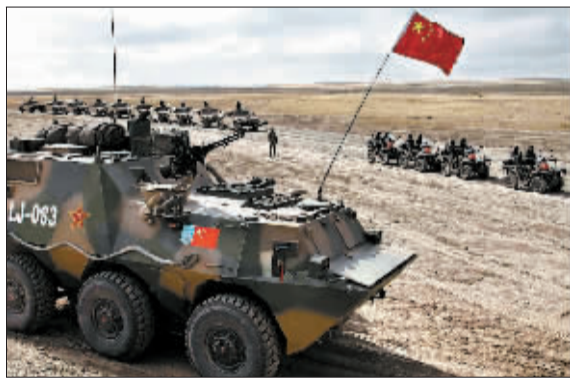
特种作战部队准备突击。