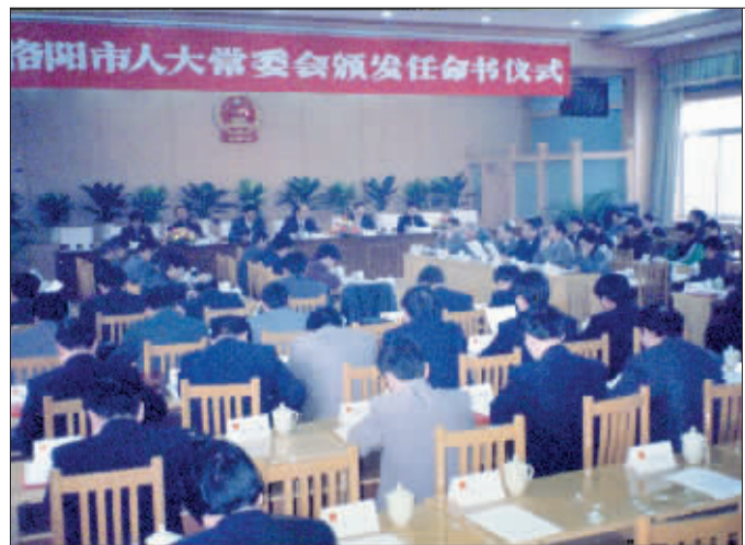
洛阳市人大常委会颁发任命书仪式