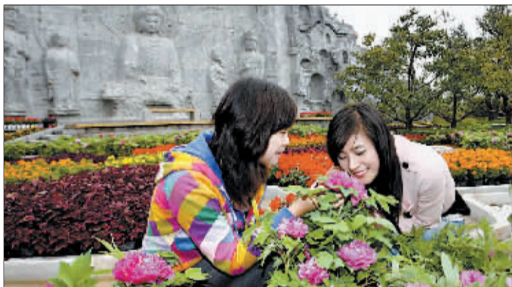
佛前花枝承玉露，中秋牡丹亦嫣然