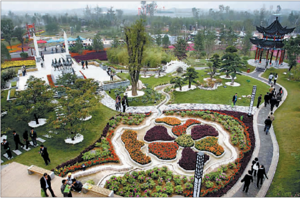
牡丹花溪穿园过，小桥曲径可通幽