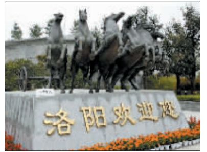
天子驾六青铜奔马雕塑